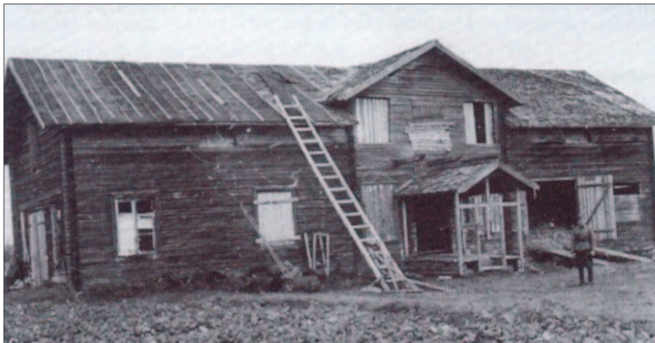
Maurasten kotitalo Koropissa jatkosodan aikana. Talo oli aiemmin kylän suurin. Ennen sotia neuvostoliittolaiset olivat muuttaneet sen navetaksi

kaa rekeen, ja veti heidät talvitietä pitkin Tuulivaaran kautta Kivivaaraan. Matkaa oli toistakymmentä kilometriä. Vanhemmat lapset auttoivat parhaansa mukaan reen vetämisessä.