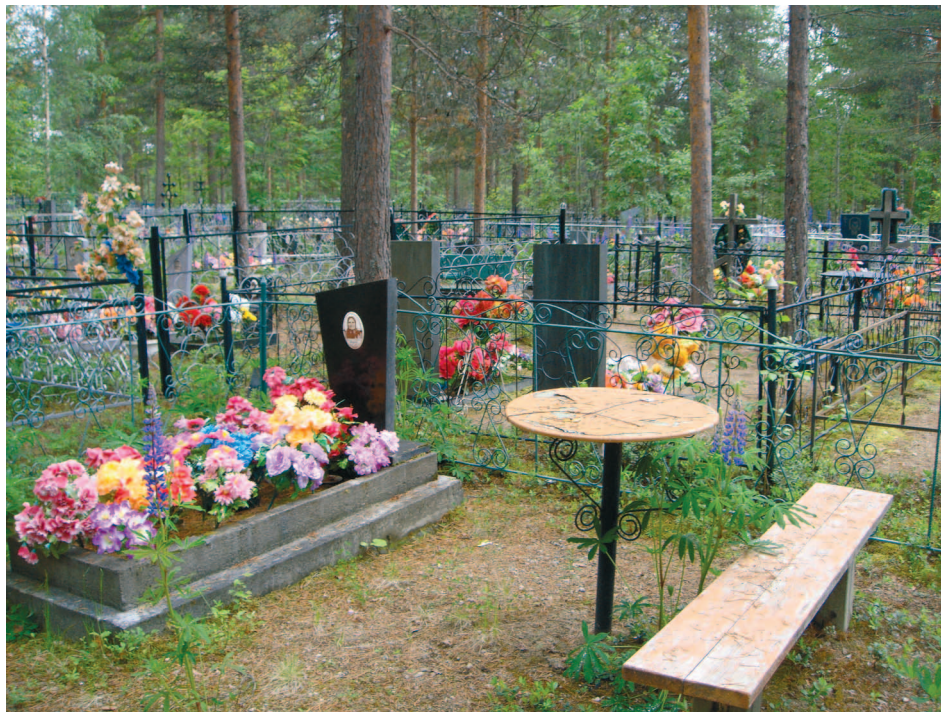
Mujejärven hautausmaa