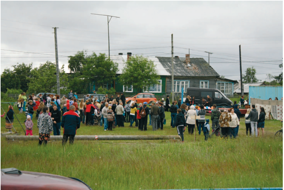
Repolan kyläjuhlat urheilukentällä