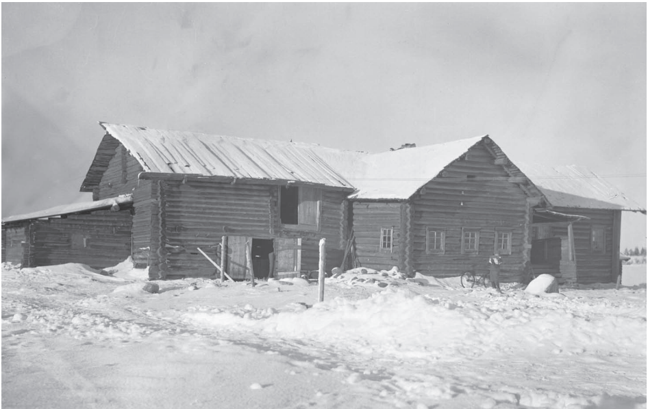
Pikarisen (Pikarin) talo Repolan Riikosenniemessä sota-aikana otetussa kuvassa