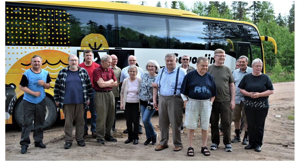
Repolan matkajat asettumassa ryhmäkuvaa matkan varrella

Kuinka sitten lieneekään esi-isäin polut silloin kulkeneet, nyt oli käsillä yksi tieto enemmän. Vaiheet suvun siirtymisestä Suistamolle sekä alueelliset yhteydet nimeen Hoskonen jäivät kiinnostamaan. Tunnetusti Shemeikat hakeutuivat Vornasten lailla salojen sydämeen, hyvien riistamaiden ytimiin, toistaiseksi kai miltei asumattomille