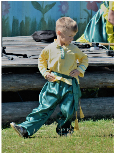
Lasten tanssiryhmän jäsenet olivat kyläjuhlan nuorimpia esiintyjiä

Rauhallisissa hetkissä voi aistia Repolan lepäävän ja tuoreen, virkeän, valppaan ja sanoisinko, kettumaisen ilmapiirin. Tunnot suodatavat joukkoon myös alueen historiaa, kohtaloita ennen ja nyt, myös