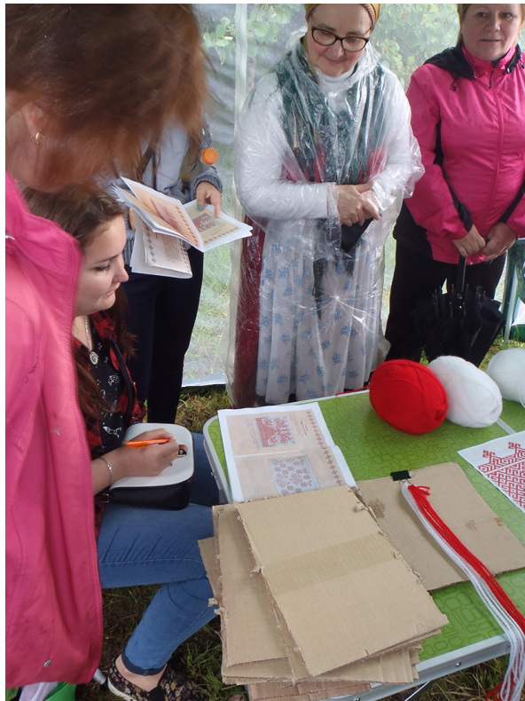
Paikallinen käsityöperinne oli esillä Haukkasaaren kyläpäivillä