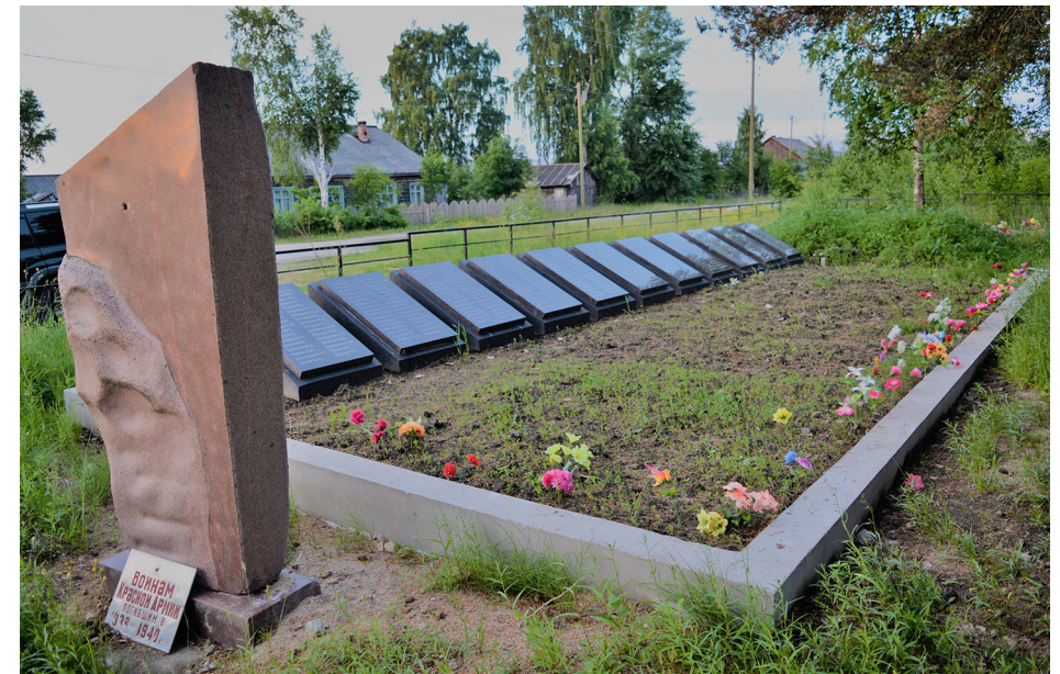
Repolaan siirrettiin kesällä 2016 Kolvasjärven lähistöltä joukkohaudasta 131 talvisodassa kaatuneen puna-armeijalaisen maalliset jäännökset. Hautapaikalle on nyt pystytetty muistomerkki ja hautakiviin kaiverrettu kaatuneiden nimet

Lisää kuvia Facebookissa ryhmässä Repola, Porajärvi . Tervetuloa mukaan ryhmään! Liittyessäsi esittele itsesi ylläpidolle (ks. ohje ryhmän sivupalkista, kohta ”Kuvaus”). https://www.facebook.com/groups/1319069558156033/