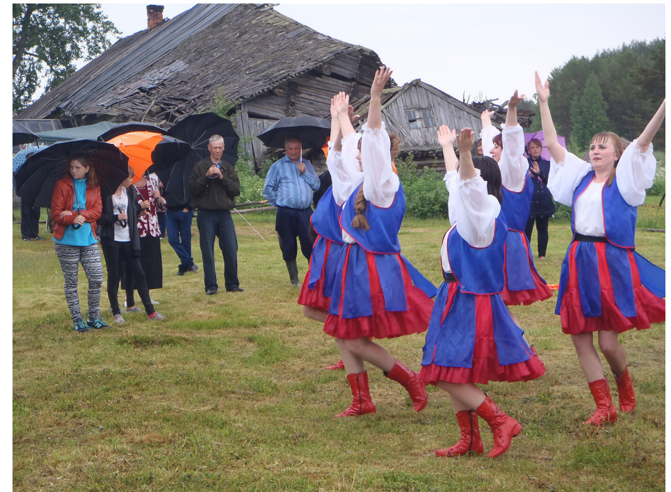
Yleisö seuraamassa tanssiesitystä Haukkasaaren viime kesän kyläpäivillä