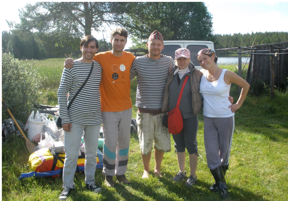
Moskovalaisnuoret aloittelemassa kahden viikon melontaretkeään Lieksanjärven ympäristössä

junalla Mujejärvelle, josta paikallinen yrittäjä oli aamulla kyydinnyt heidät tavaroineen Haukkasaareen. He esittelivät meille kahta kootavaa saksalaisperäistä kanoottia, joilla he aikoivat meloa kahden