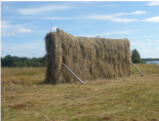
Haukkasaarissa kuivataan heinää haasioissa

1900-luvun alussa Haukkasaarissa oli yhdeksän taloa, joista kuudessa asui Pottosia, kahdessa Kana-