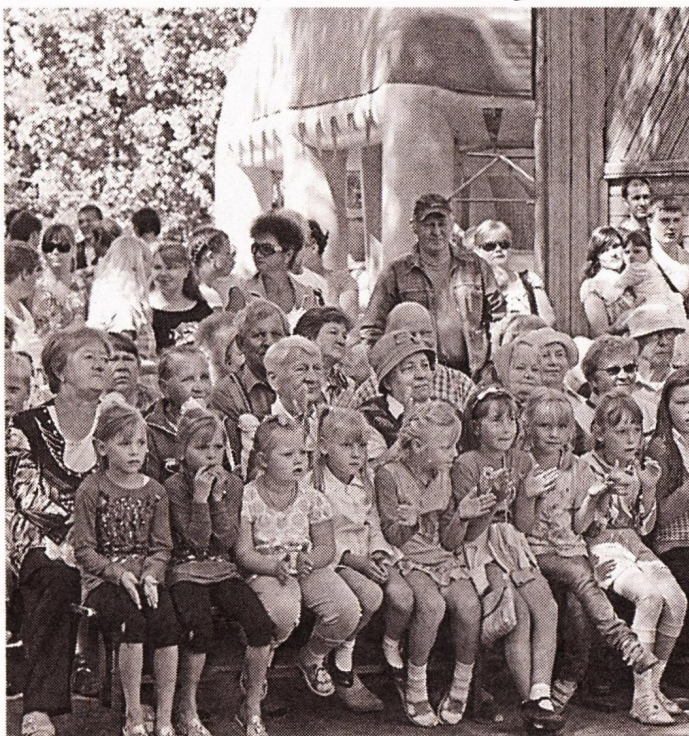
Kyläpruasniekka on suuri tapahtuma kaikille kyläläisille.

Kulttuuritalolla on suuri merkitys joka kylän elämässä. 45-vuotispäiväänsä juhlivassa Repolan kulttuuritalossa toimii kerhoja, siinä harjoittelevat lasten ja aikuisten perinneryhmit.